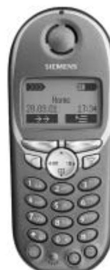
Aparat 4000 Micro