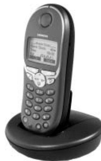
Gigaset 4000 Micro z ładowarką

Informacje zawarte w niniejszym dokumencie zawierają tylko ogólne opisy i charakterystyki parametrów, które nie zawsze dotyczą rzeczywistych zastosowań w opisany tutaj sposób, lub które mogą ulec zmianie w trakcie prac rozwojowych nad produktami. Dostępność produktów i ich parametry techniczne mogą ulec zmianie bez uprzedzenia.