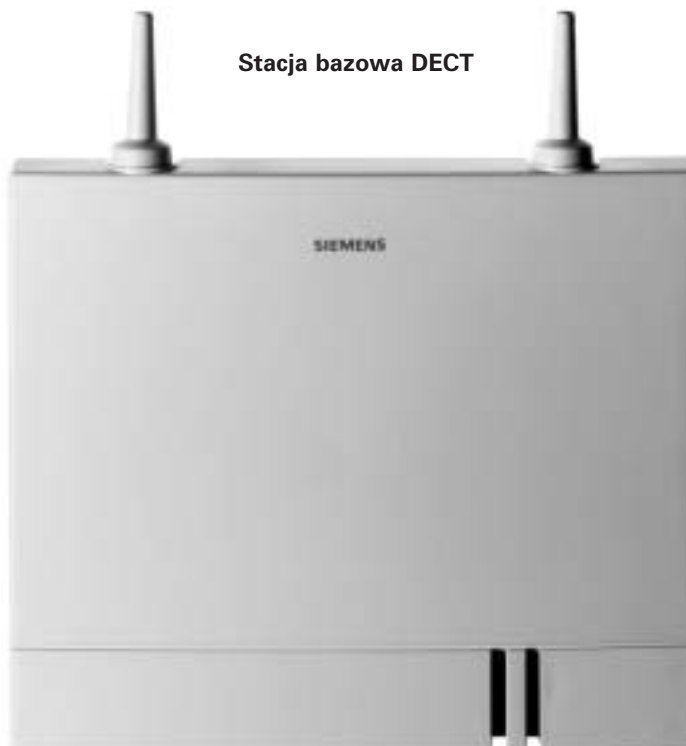
Stacja bazowa DECT