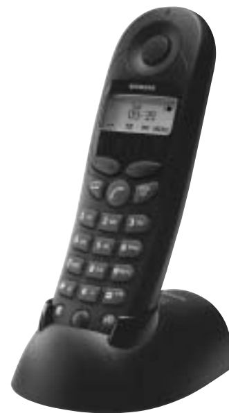
Gigaset 4000 Comfort z ładowarką