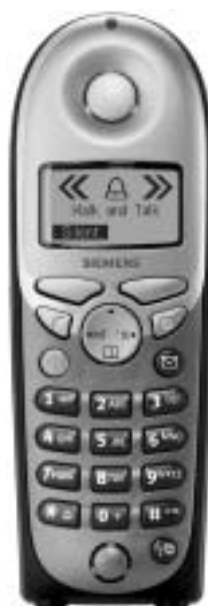
Aparat 4000 Comfort